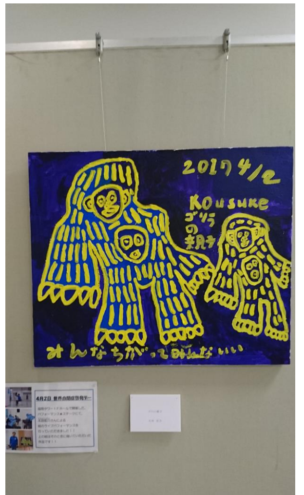
パフォーマンス ステージ:大田宏介さん作品